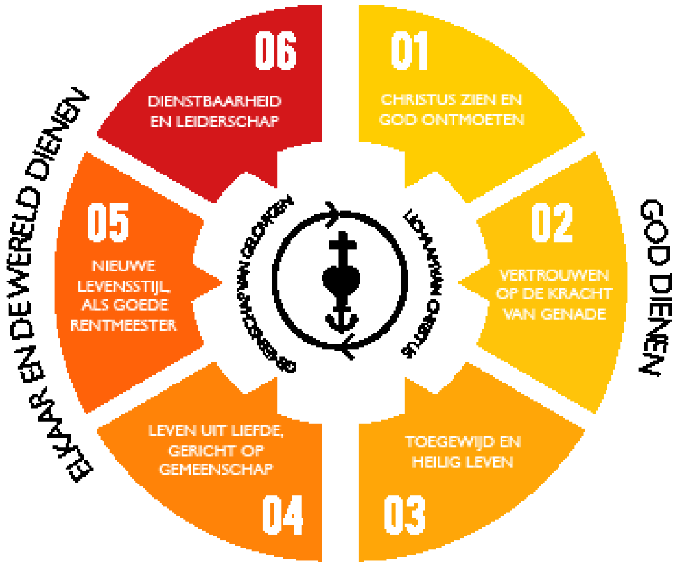
FIGUUR: ZES GELOOFSPRAKTIJKEN